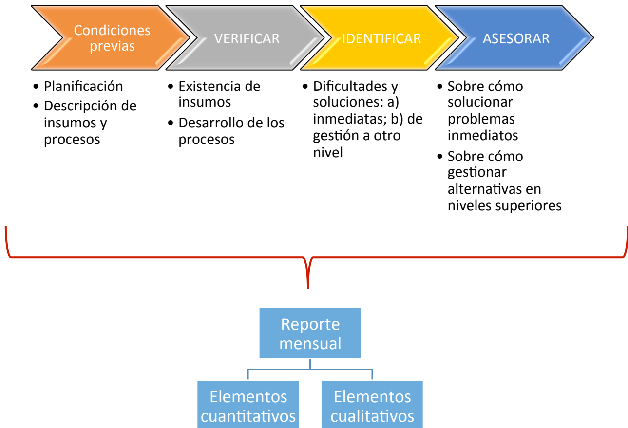
Gráfica 3. Síntesis de la supervisión

La gráfica 3 ofrece la síntesis de lo que implica realizar el proceso de supervisión.